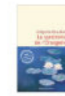
Grégoire BOUILLER Le syndrome de l'orange