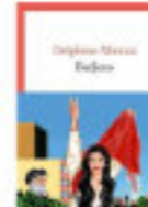
Delphine MINOUI Badjens