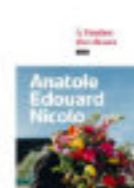
Anatole Edouard NICOLO A l'ombre des choses