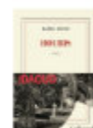
Kamel DAOUD Hours