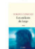
Virginia TANGVALD Les enfants du large