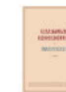
Maryline DESBIOLLES L'agraffe